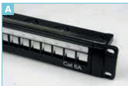
Suporte do painel Cat 6A