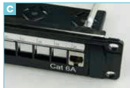
Insira o conector corretamente no local de montagem.