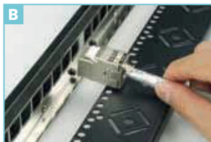
Posicione o conector keystone blindado para instalação.